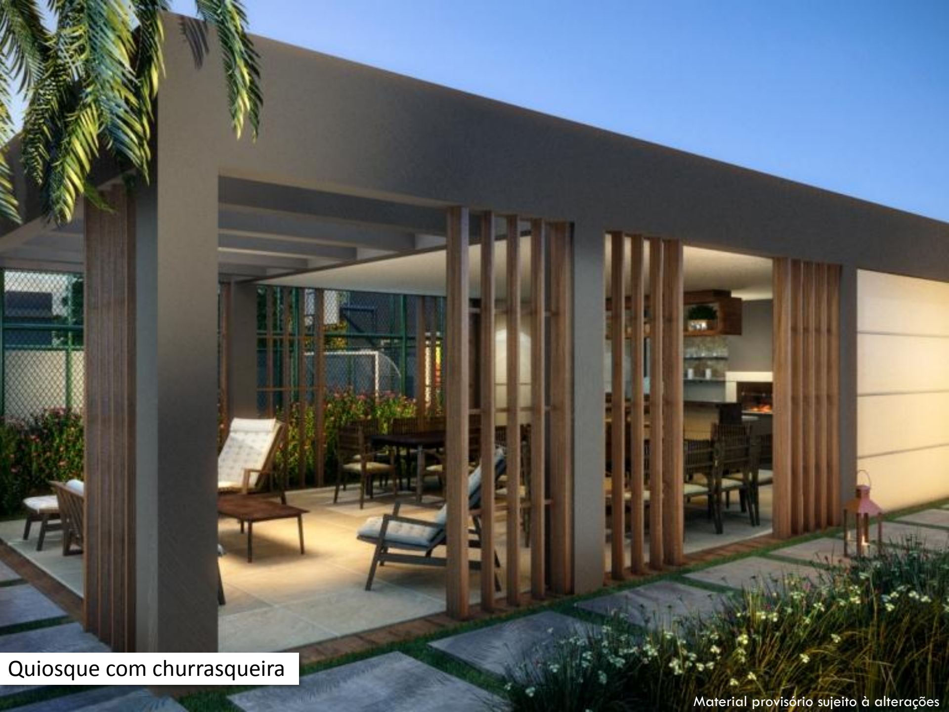
Quiosque com churrasqueira

Material provisório sujeito à alterações