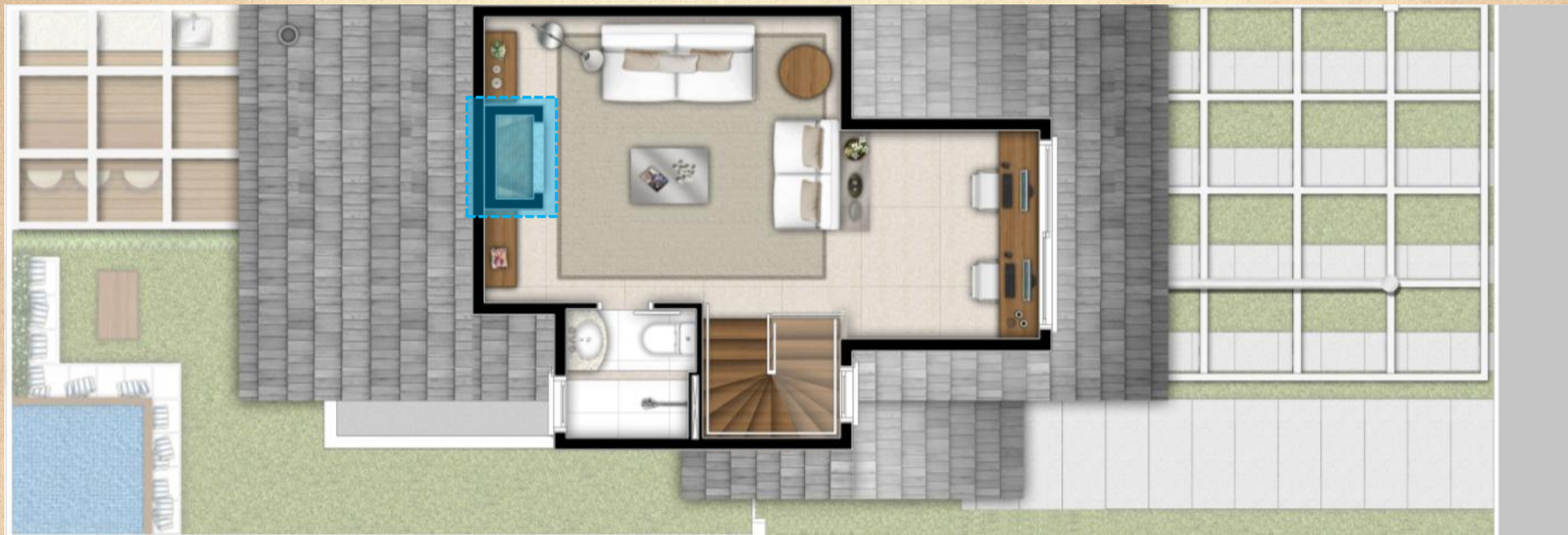
PLANTA BAIXA SÓTÃO