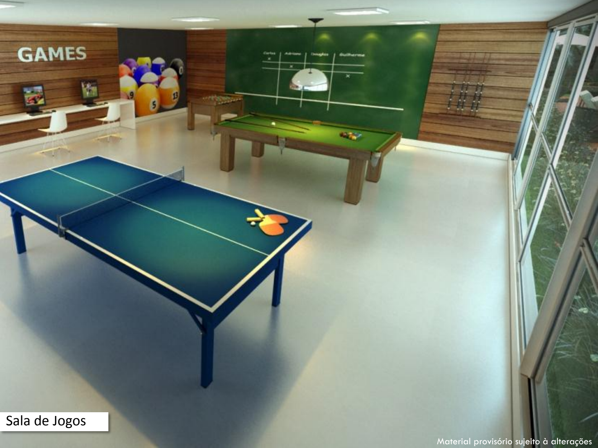
Sala de Jogos