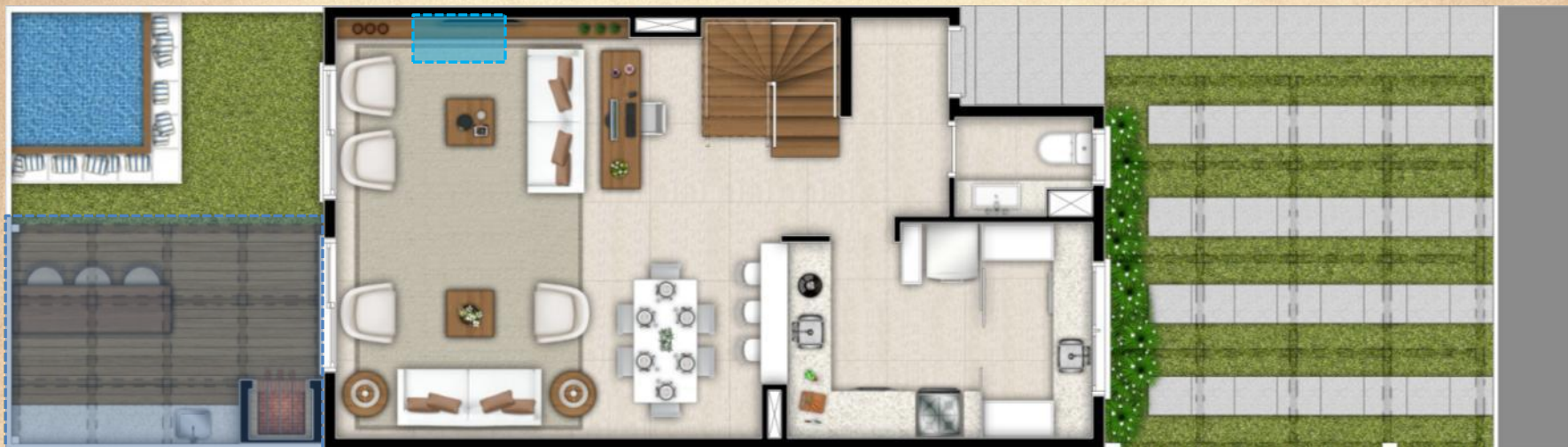
PLANTA BAIXA TÉRREO